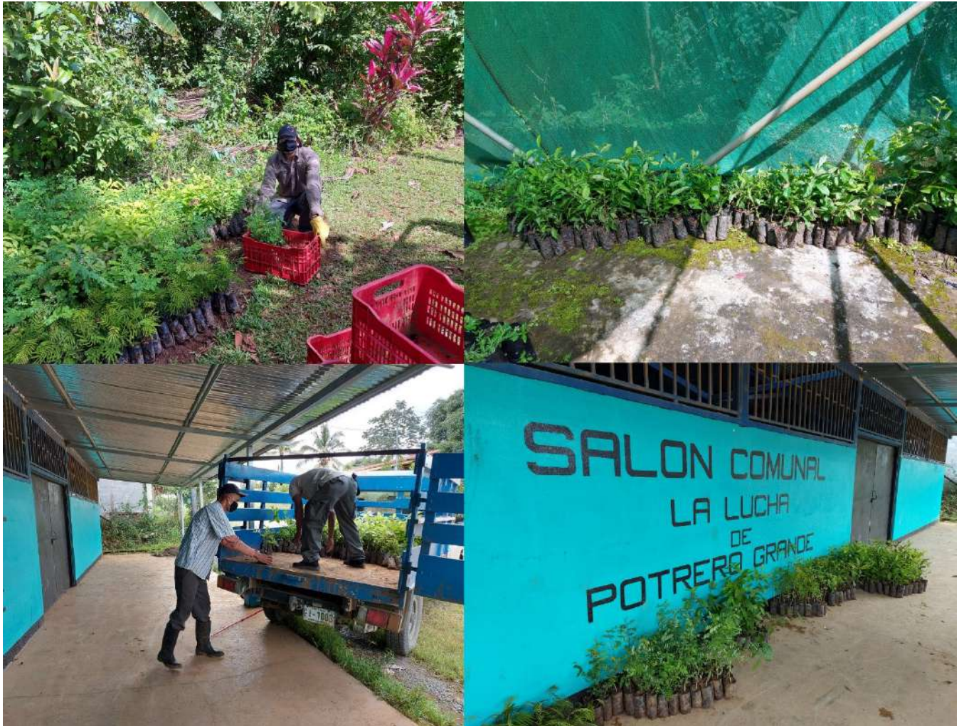
Figura 1. Entrega de árboles donados por PINDECO a los proyectos de ASOMOBI y La Lucha, 02 de octubre 2020.