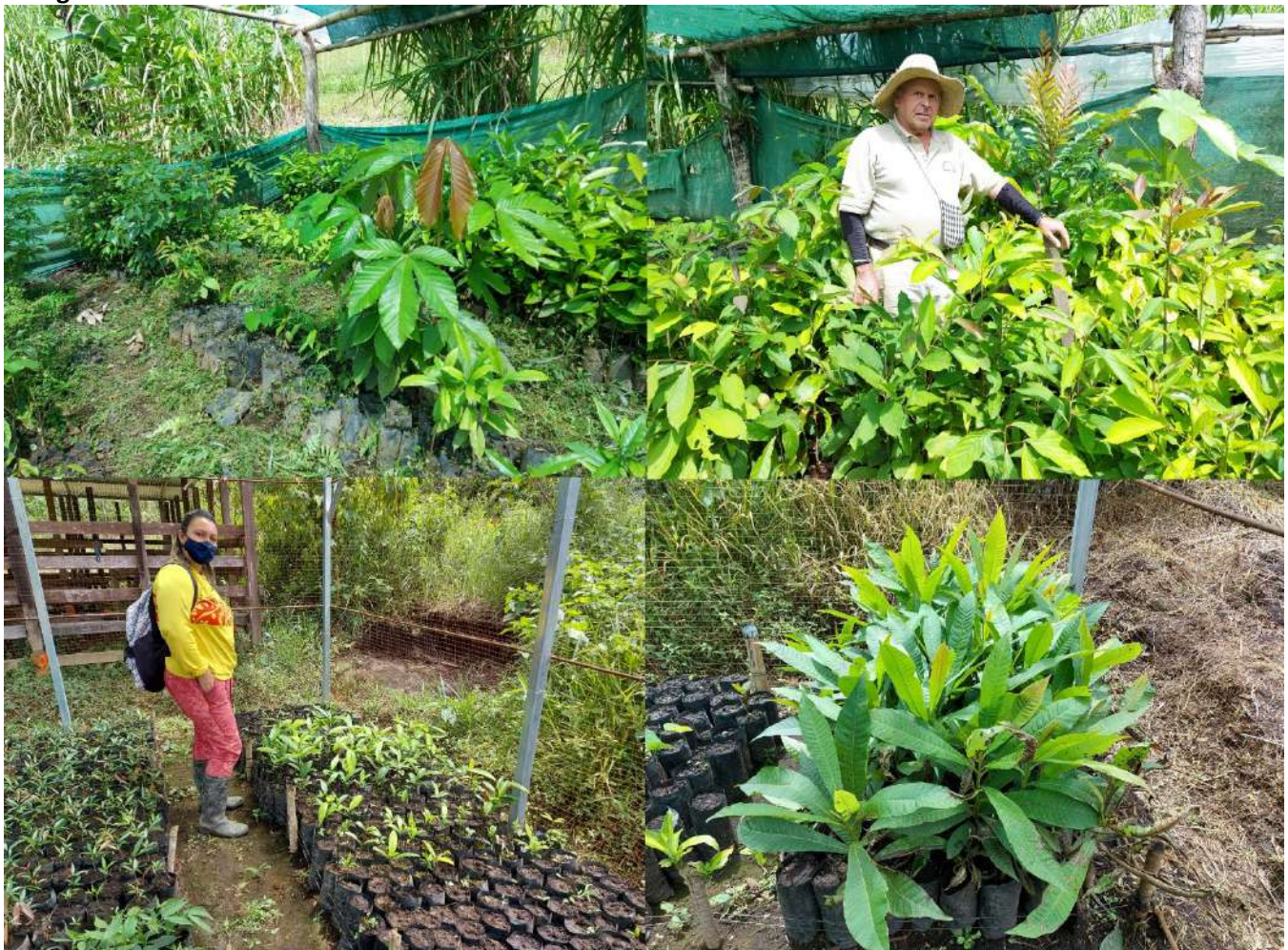
Figura 3. Visita a los viveros de la CGIZS y Fila Tigre, 29 de octubre 2020.