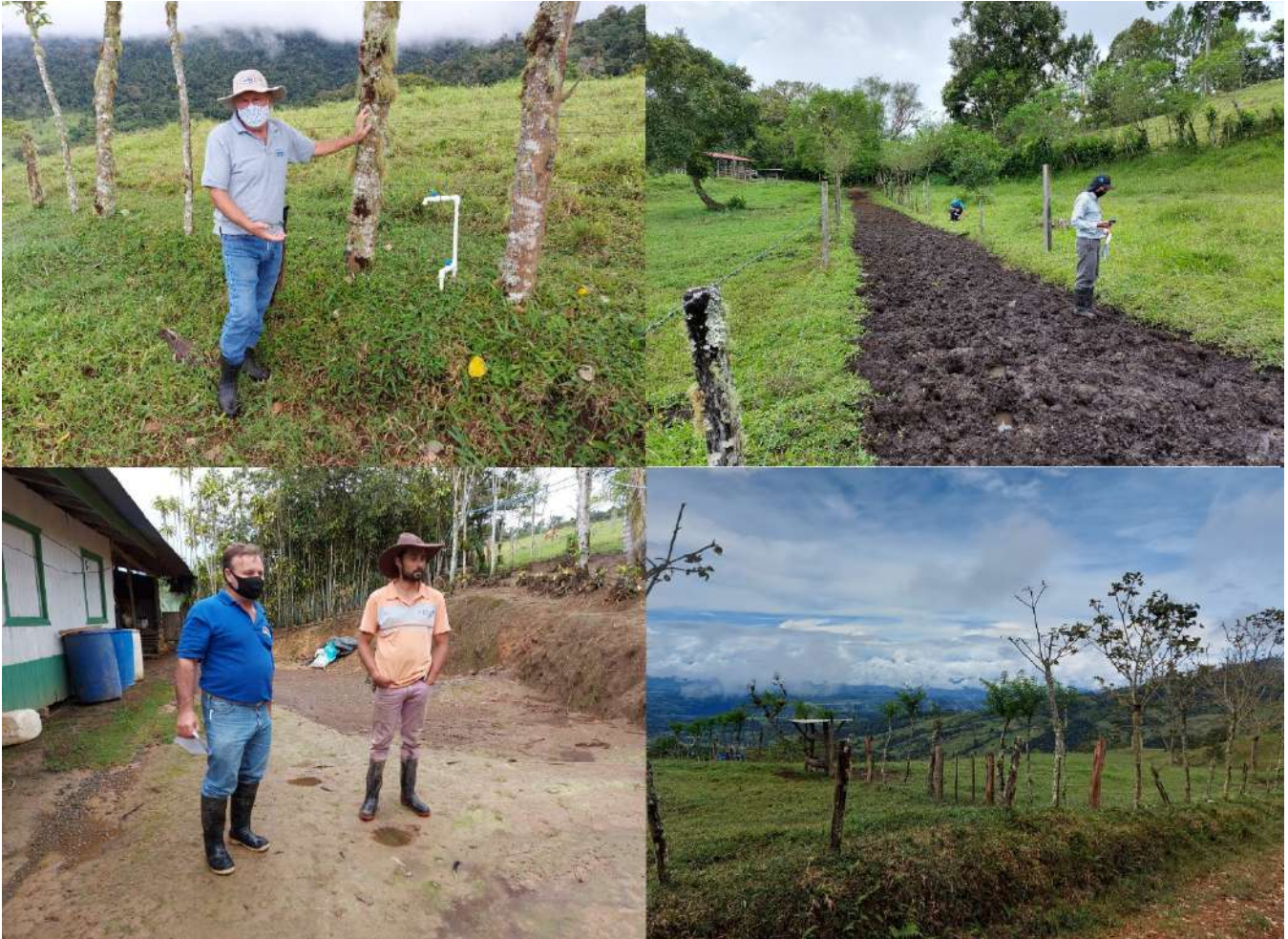
Figura 2. Visita a personas productoras de la CGIZS, 28 de octubre 2020.